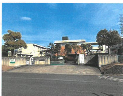
木津川市立木津第二中学校 約900m(徒歩約12分)