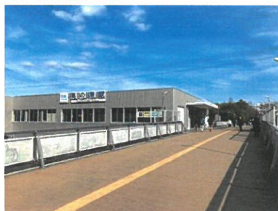
近鉄京都線「高の原」駅 約1000m(徒歩約13分)