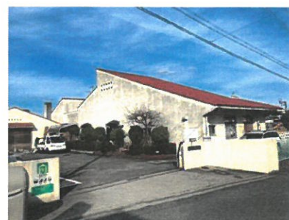
相楽台保育園 約230m(徒歩約3分)