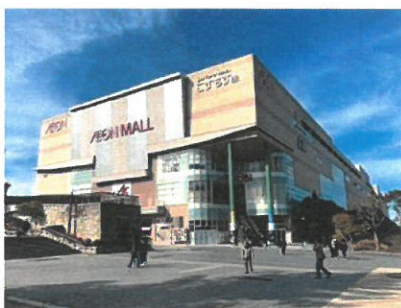
イオンモール高の原 約700m(徒歩約9分)