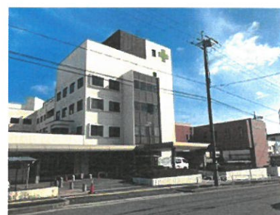
高の原中央病院 約1400m(自動車約4分)

※距離表示については地図上の概測距離を、徒歩分数表示については80m、自転車は200m、自動車は400mを1分として算出し、端数を切り上げたものです。