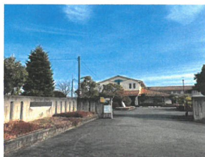
木津川市立相楽台小学校 約950m(徒歩約12分)